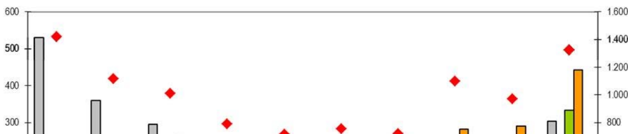
Grafico 1 – Comuni toscani. spesa corrente pro-capite complessiva (scala dx) e per alcune funzioni (scala sn). 2010

I costi espliciti sono dati sostanzialmente dai costi fissi di funzionamento degli enti nella loro parte di amministrazione generale e di rappresentanza politica e sono quantificabili in modo relativamente facile. Una semplice rappresentazione della spesa pro-capite dei comuni per funzioni e classe dimensionale evidenzia il mancato sfruttamento di economie di scala per i costi di funzionamento degli enti sottodimensionati (grafico 1).