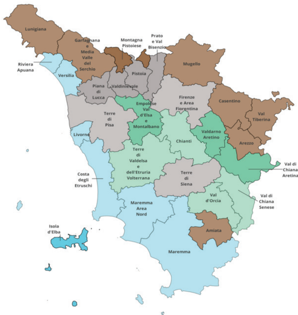
Figura 5 RISULTATI DELL'ANALISI CLUSTER GERARCHICA CONDOTTA PER GLI AMBITI TURISTICI OMOGENEI DELLA TOSCANA - METODO DI WARD